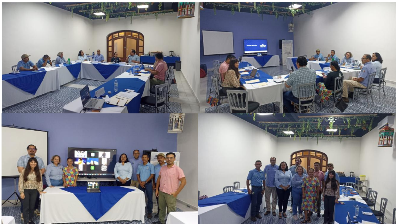
Reunión de trabajo sobre la 3ra sesión de diálogos interinstitucionales del proyecto del Anzuelo al Plat (18-19 de septiembre de 2025), donde fue participe IMIPAS, CONANP, CONAPESCA y WWF.

La Cruz de Huanacaxtle, Nayarit a 22 de septiembre de 2025