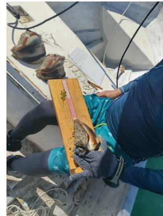
Figura 3. biometrias de los ejemplares de caracol.