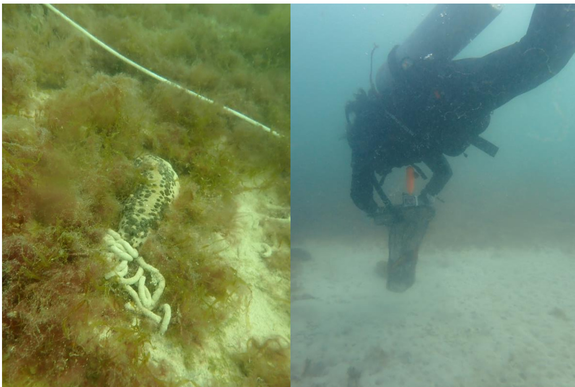
Figura 2. Pepino junto a transecto (izquierda), colecta de organismos durante la inmersión (derecha).

Se realizaron 5 inmersiones por día, sumando un total de 20; en las cuales se utilizaron transectos en banda de 100 m de longitud, con 4 m de ancho (figura 2). A lo largo de cada transecto, se identificaron y colectaron ejemplares de las especies de interés. Una vez en la embarcación, cada organismo fue medido y pesado, para ser posteriormente devuelto a su habitat (figura 3).