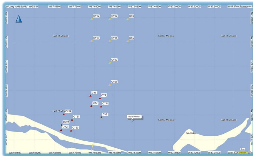
Figura 1. Ubicación de sitios de buceo en la costa del cuyo y río lagartos.

Durante la presente comisión, se visitaron las comunidades del cuyo y río lagartos en Yucatán, la cual sirvió como base para realizar el trabajo. En dichos sitios, se realizaron inmersiones de buceo tipo SCUBA, para determinar el estado de las poblaciones de especies bentónicas, específicamente pepinos de mar, caracoles y pulpos (figura 1).