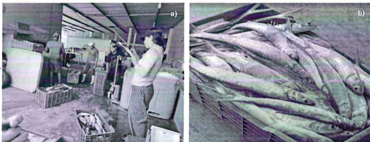
Figura 1. Muestreo biológico de escama: a) Entrevista a pescadores en bodega Lezama en Champotón.; b) Toma de datos biométricos de palometa en muelle de Champotón de macabí ( Elops saurus ).