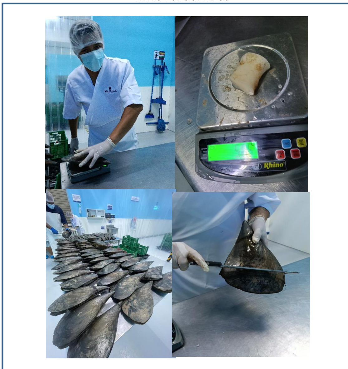
Monitoreo callo de hacha en las instalaciones de la Planta MOLLUSCA de la Cooperativa Almejas SF y Pesquera Mar Profundo, el día 09 de julio de 2025.