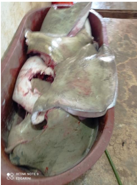
Figura 3. Especie capturada, H. americanus