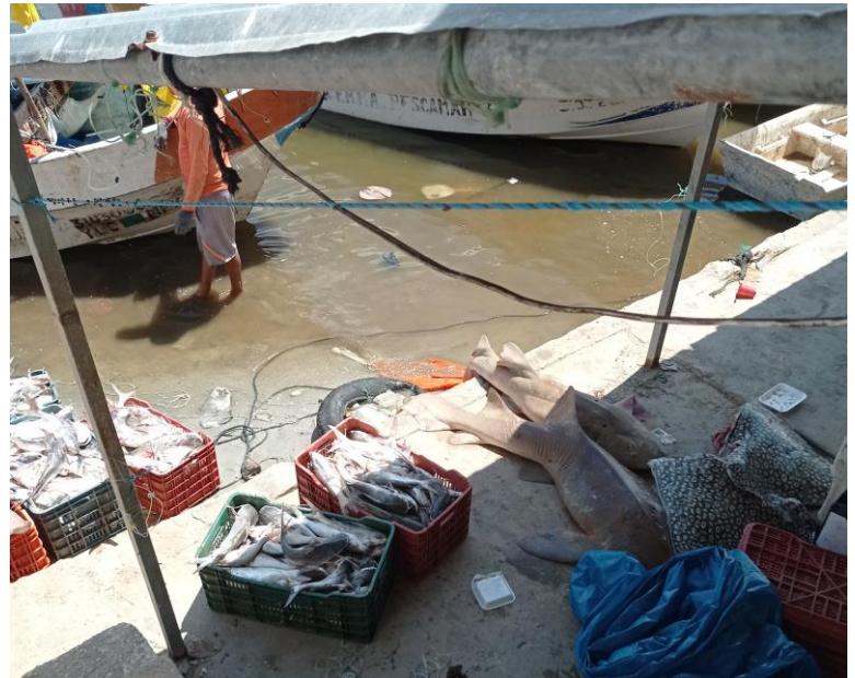
Figura 2. Descarga de la captura