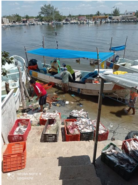
Figura 1. Descarga de la captura