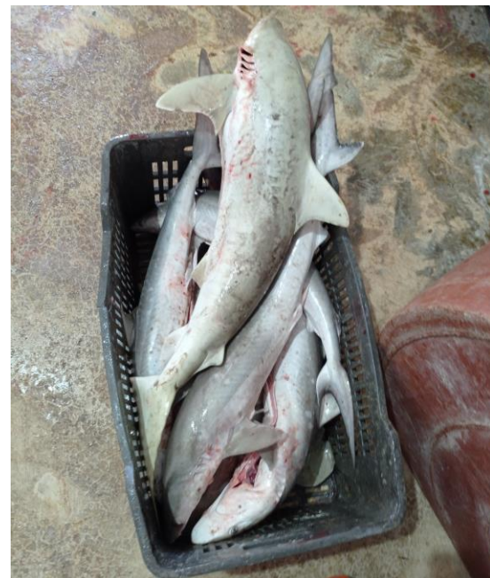
Figura 4. Especie capturada, C. acronotus y R. terraenovae