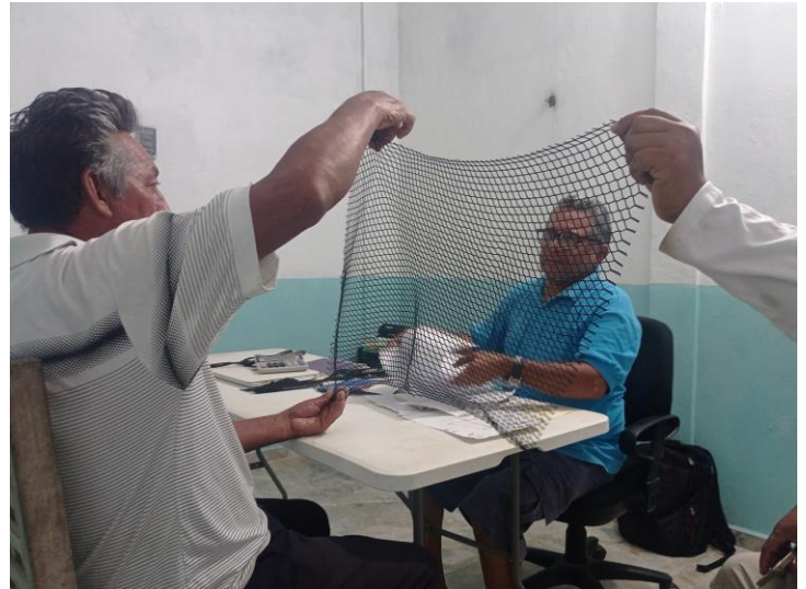
Figura 6. Ejercicio sobre el corte de la malla.