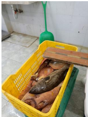
06-jun-2024. Captura total de un viaje de pesca de Buceo de una embarcación artesanal en el Puerto de Sisal