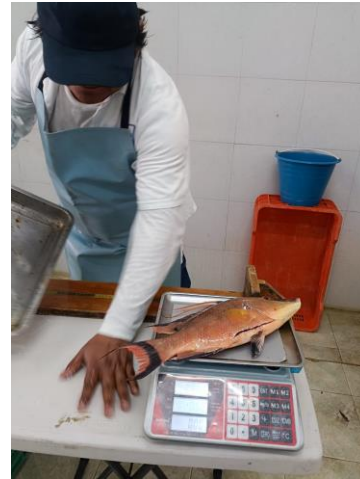
06-jun-2024. Registro de las características biométricas de la captura registradas por embarcaciones artesanales en el Puerto de Sisal