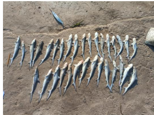
07-jun-2024. Captura incidental de la una embarcación sardinera registrada en el Puerto de Celestún