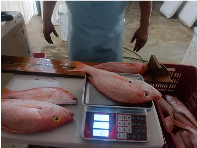
05-jun-2024. Registro de las características biométricas de la captura de los lanchones en el Puerto de Celestún

Se adjuntan algunas fotos de evidencia de las actividades realizadas: