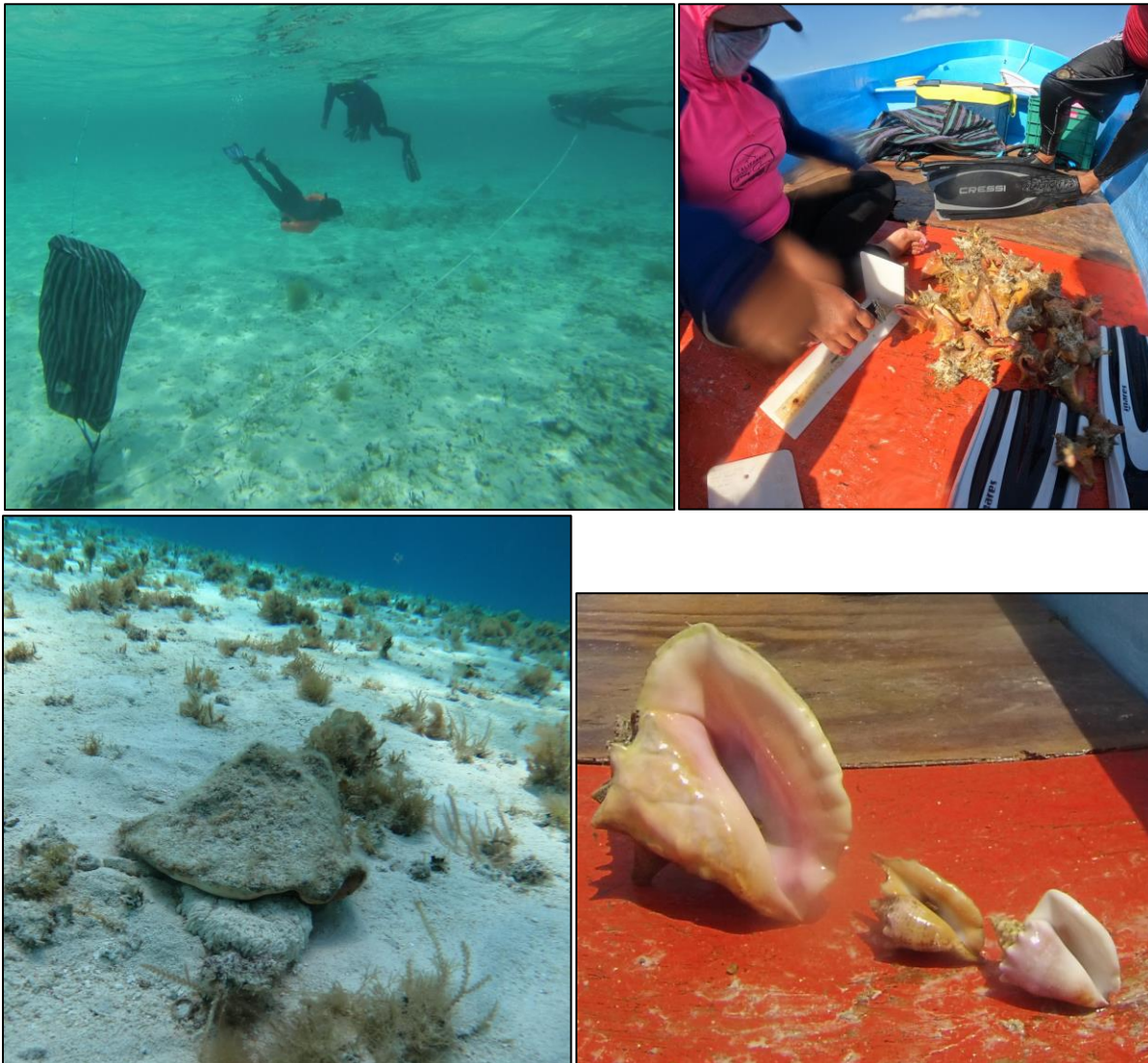
Figura 4. Fotografías del monitoreo de caracol. Muestreo con el círculo marcado, toma de biometría de los individuos muestreados, caracol rosado hembra con puesta de huevos, y caracoles de diferente talla.