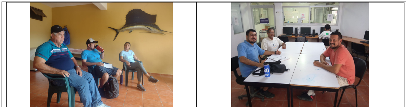
Figura 1. Evidencia de reporte de fenómeno climatológico y reuniones de trabajo con socios de la SCPP. de Altura y Servivions Turísticos las Playas de Marte, SC de RL y profesor-investigador de la unidad de Melaque – U de G y el CRIAP-Manzanillo, IMIPAS.