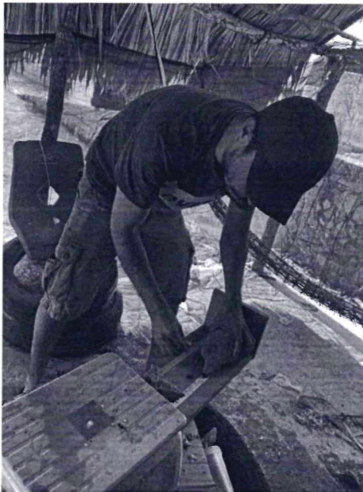
Figura 1. Muestreo de caracol, toma de biometrías: longitud total de concha, peso total, peso de callo y sexo.