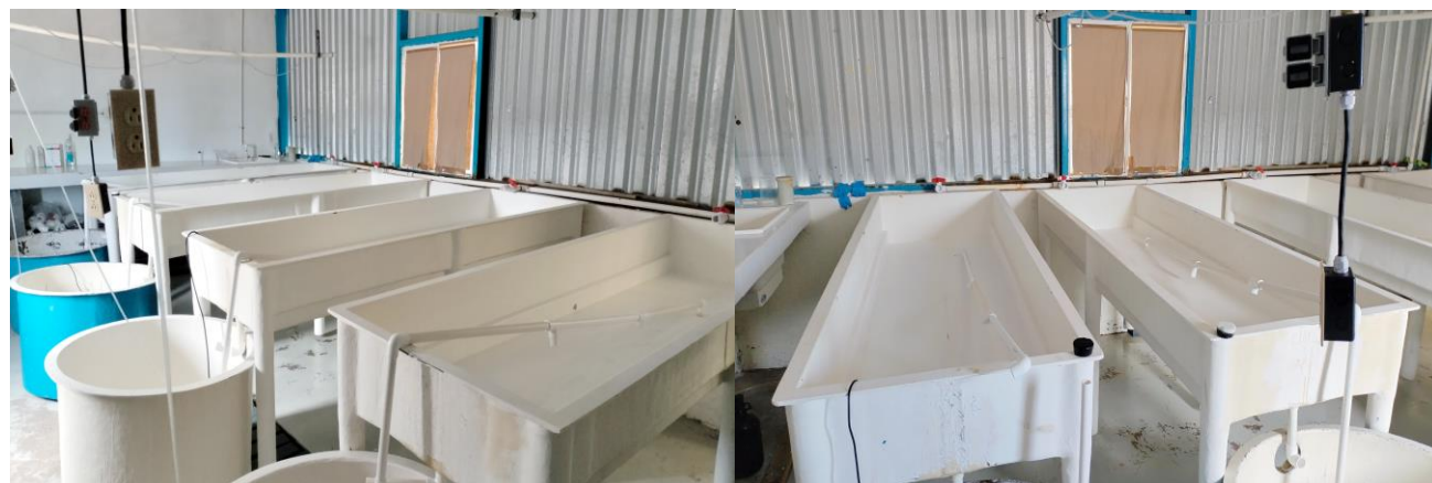
Figura 3.- Vista de los tanques de fibra de vidrio para la sala larvario y área de reproductores para el ostión Crassostrea gigas en el CREMES.