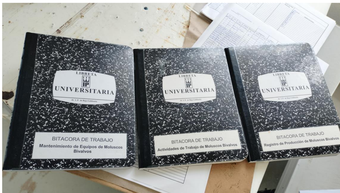
Figura 2.- Vista de tres libros “Bitácoras de trabajo para el mantenimiento de Equipos, Bitácora de Actividades par Moluscos Bivalvos y Bitácora de Registro de Producción.