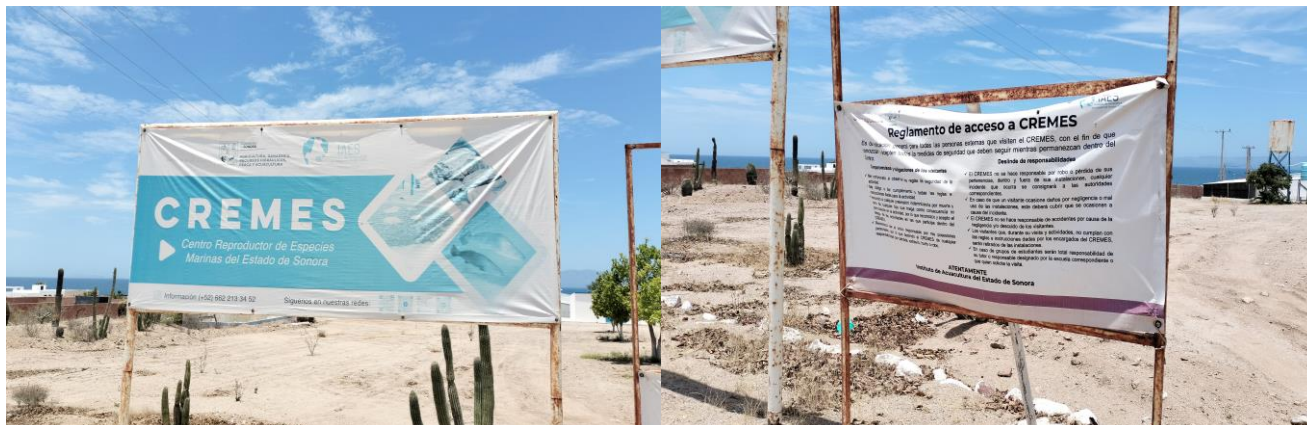
Figura1.- Vista letreros informativos a la entrada el Laboratorio del IAES, Reglamento de acceso y condiciones al entrar el CREMES. Centro Reproductor de Especies Marinas del Estado de Sonora.