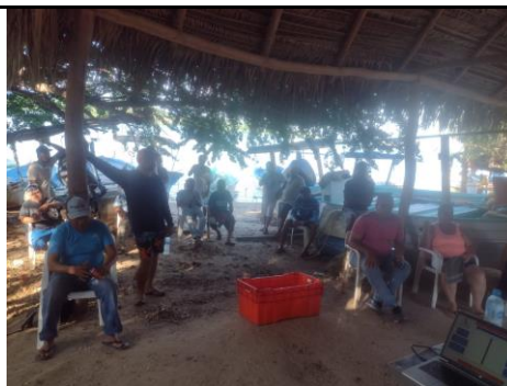
Figura 1. Evidencia de reunión de trabajo con socios de la cooperativa pesquera La Culebra.